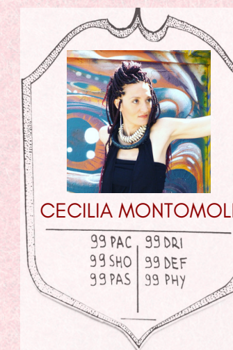
Championne de lancer de poids lourds