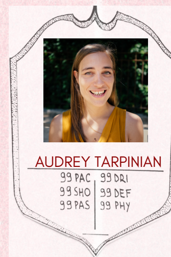
Championne de relais effet-mère