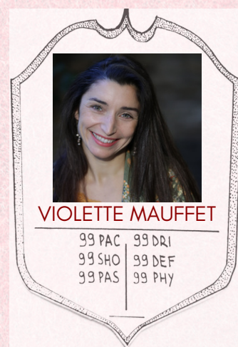
Championne de course de désorientation