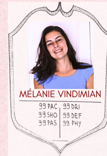
Championne de saut dans le vide

Attaché.e.s à réfléchir à des formes de spectacles pour des lieux non dédiés et favorisant l'accessibilité à de nouveaux publics, ce projet alliant Culture et Sport tant par son contenu que par sa mise en œuvre qui se fait en lien avec des événements sportifs locaux nous tient particulièrement à cœur. Comment rassembler ces deux mondes qui ont à voir avec le spectaculaire, comment se jouer des clichés, se décaler pour mieux se rencontrer ?