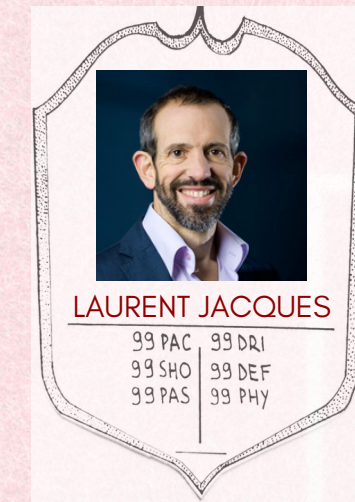
Champion de nage effet papillon